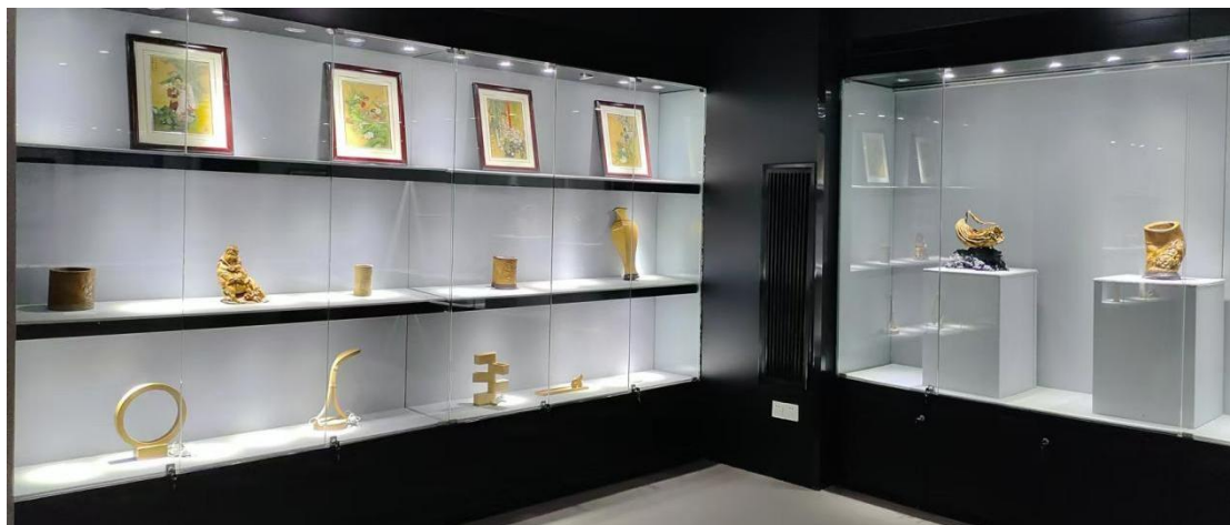
2、竹木制作实训分室