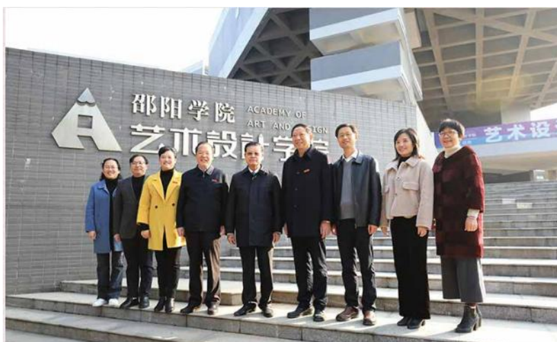
老挝前副总理宋沙瓦 · 凌沙瓦来我校访问