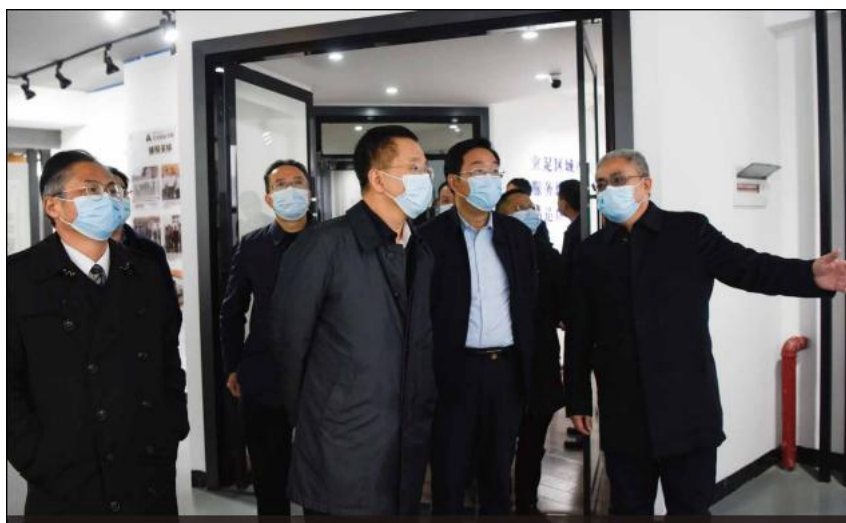
湖南省教育厅厅长夏智伦在学校党委书记宁立伟陪同下莅临设计艺术学院指导工作