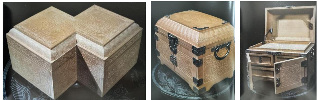
竹簧首饰盒、梳妆盒