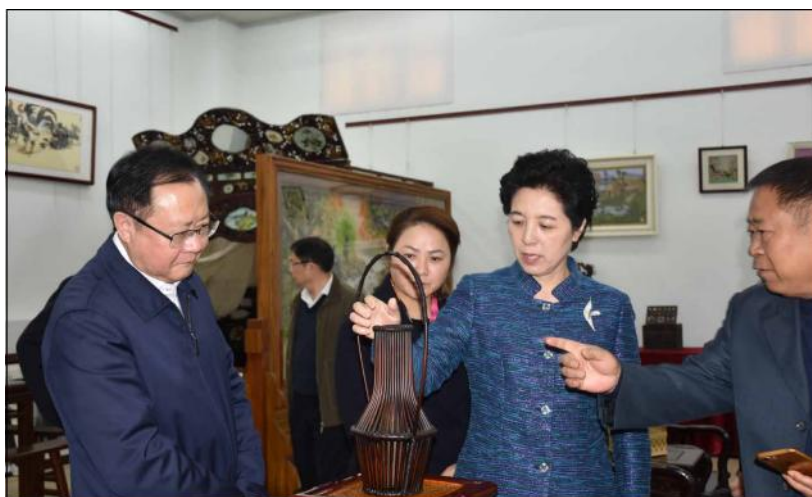
2018 年湖南省委副书记乌兰来我院校企合作创新创业教育 基地——华立竹木制品有限公司调研