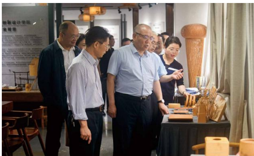
中国文联党组成员、副主席董耀鹏一行来华立竹木创新