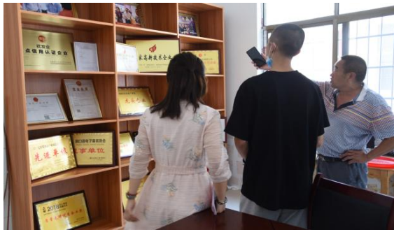
④湖南省邱记食品有限公司