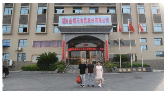
③湖南金福元股份有限公司