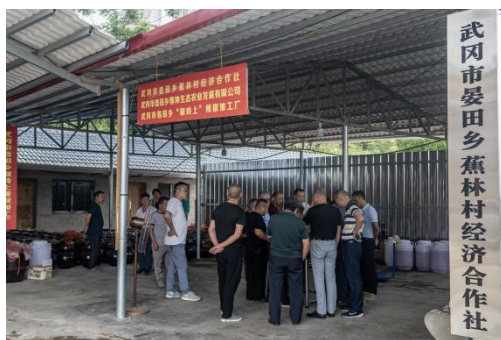
⑦晏田乡蕉林村经济合作社