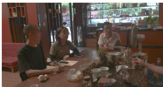
②湖南隆回一都富硒茶叶股份有限公司