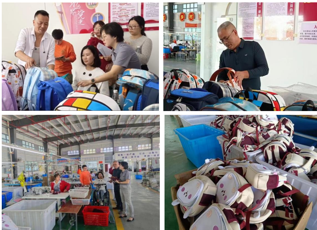
⑧湖南七七科技股份有限公司