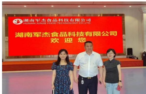
⑧湖南军杰食品科技有限公司