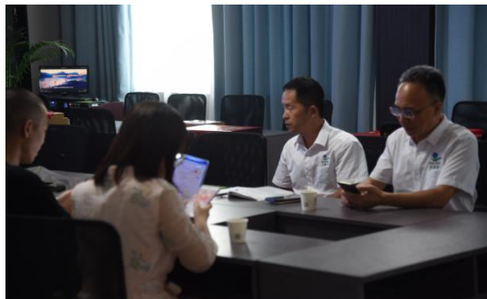
⑤湖南天香生物科技有限公司