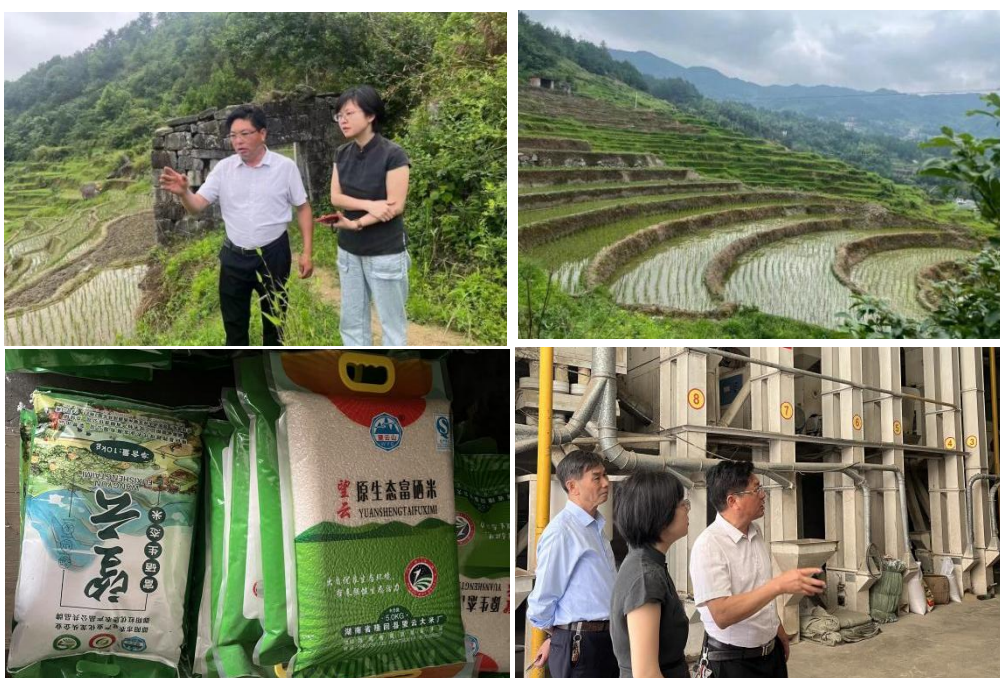
①、隆回县跨越现代农业发展有限公司