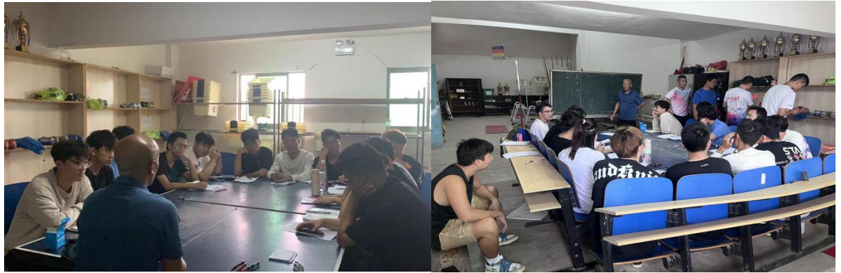
图为实习前的备课