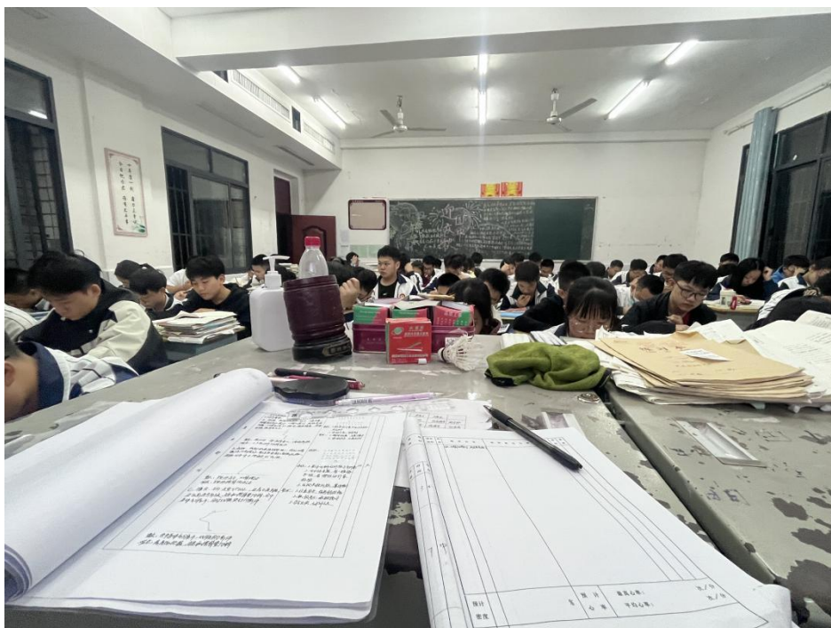
图为实习班主任监考周考