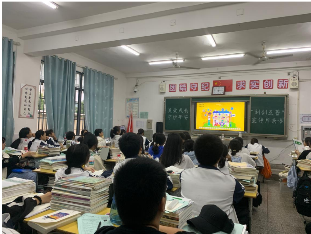
此图为学生观看“关爱成长，守护平安，利剑互蕾宣传片”