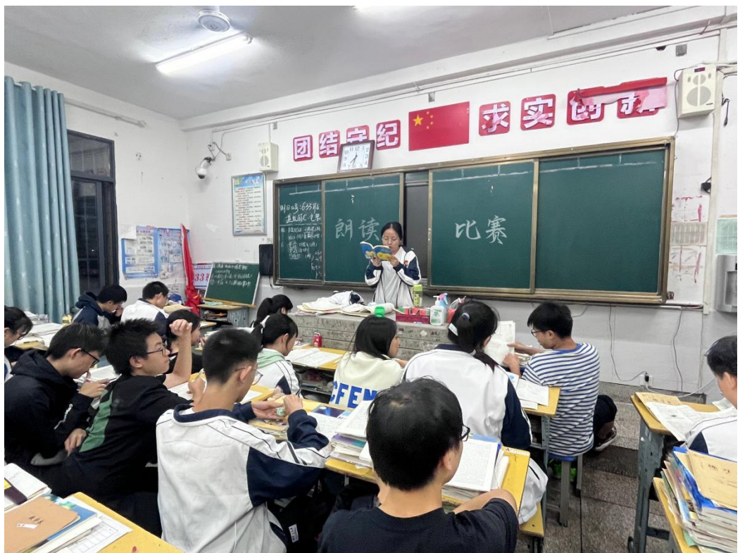
此图为班级“朗读比赛”