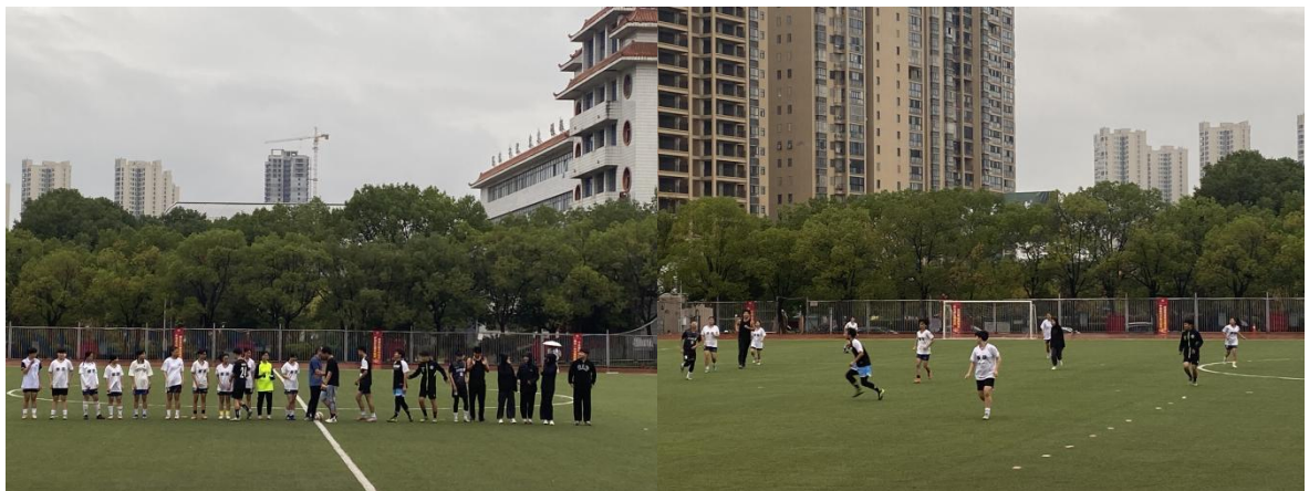
图为女足校队赛前和实习老师队伍的比赛