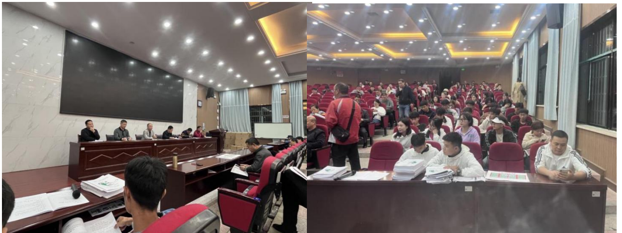
图为校运会前期工作安排会议的召开