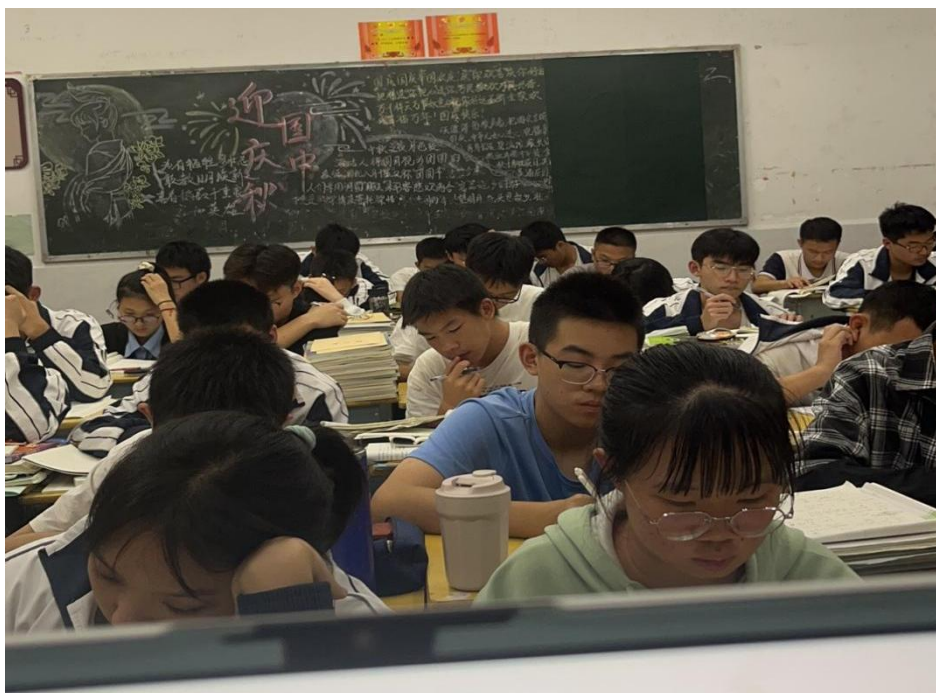
图为晚自习坐班的实习老师