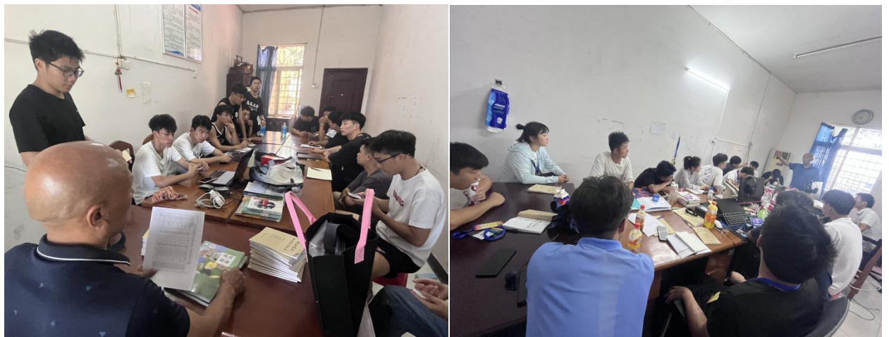
图为实习老师们来新邵一中备课、交流