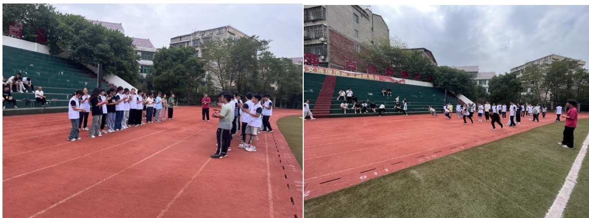
此图为向彩政老师上课