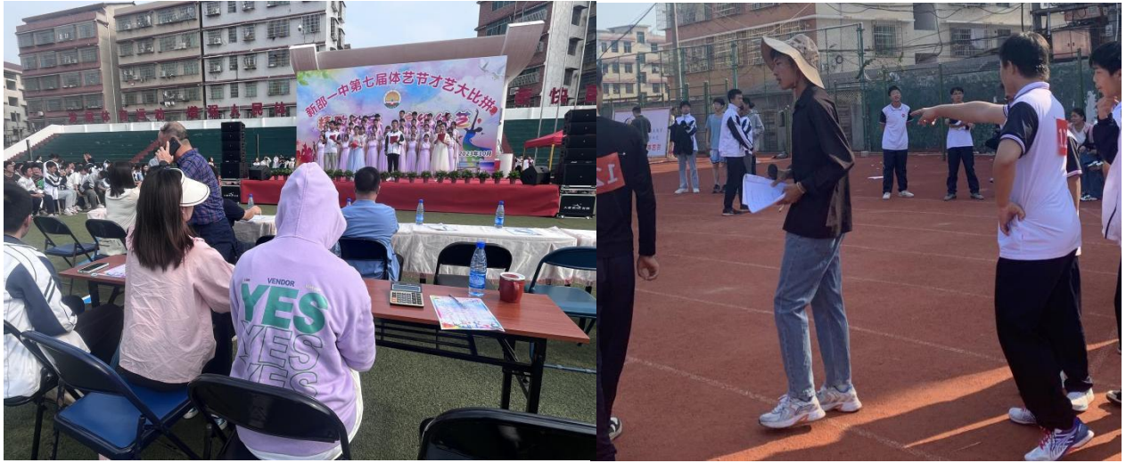
图为体艺术节统分组的实习老师和认真执裁的实习老师

实习征途还未结束，新邵一中实习队的激情依旧昂扬。对每个组员来说，这都是一个提高自己，检验所学的过程。我们充分把握机会，初步掌握了从事教育教学工作的基本技能，学会了对学生进行思想教育的方法和手段，也深深体会了做一名光荣的人民教师的艰辛和不易，深感肩上的责任重大，对教师这一神圣的职业有了更深刻的理解和认识，体验到了教师的苦乐酸甜，为我们以后的教师之路打下了坚实的基础。在接下来的征途中，我们也将继续砥砺前行！