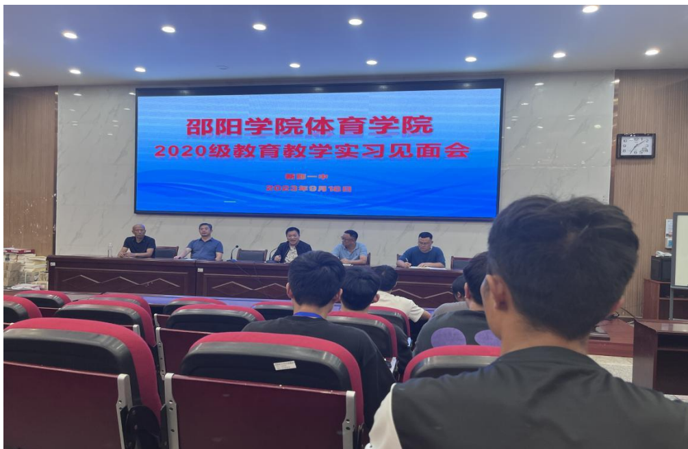
图为学校领导班子发言