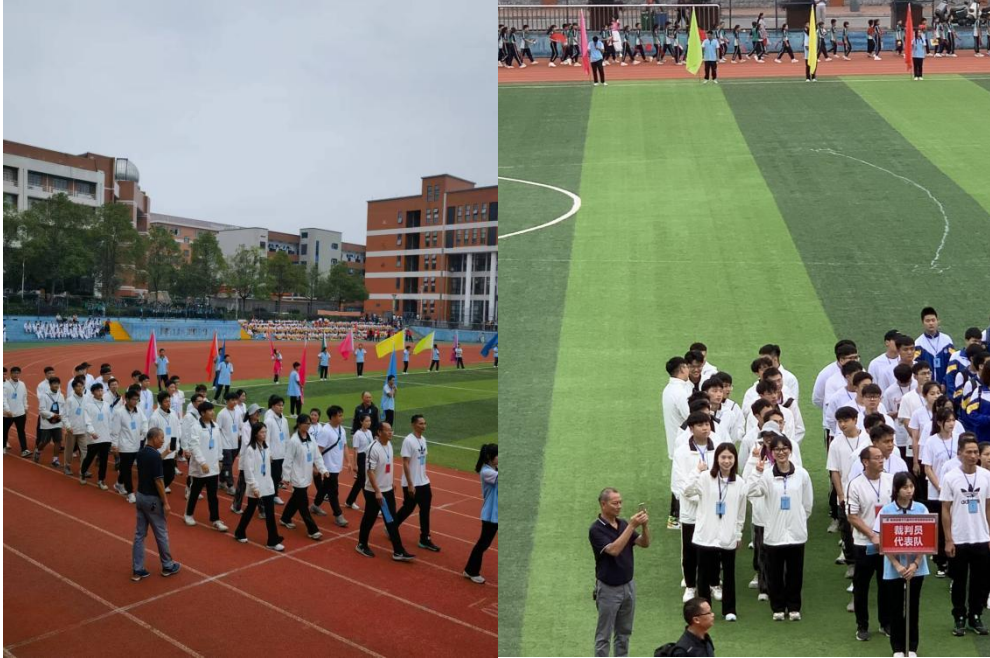
图为县运会入场的裁判员们