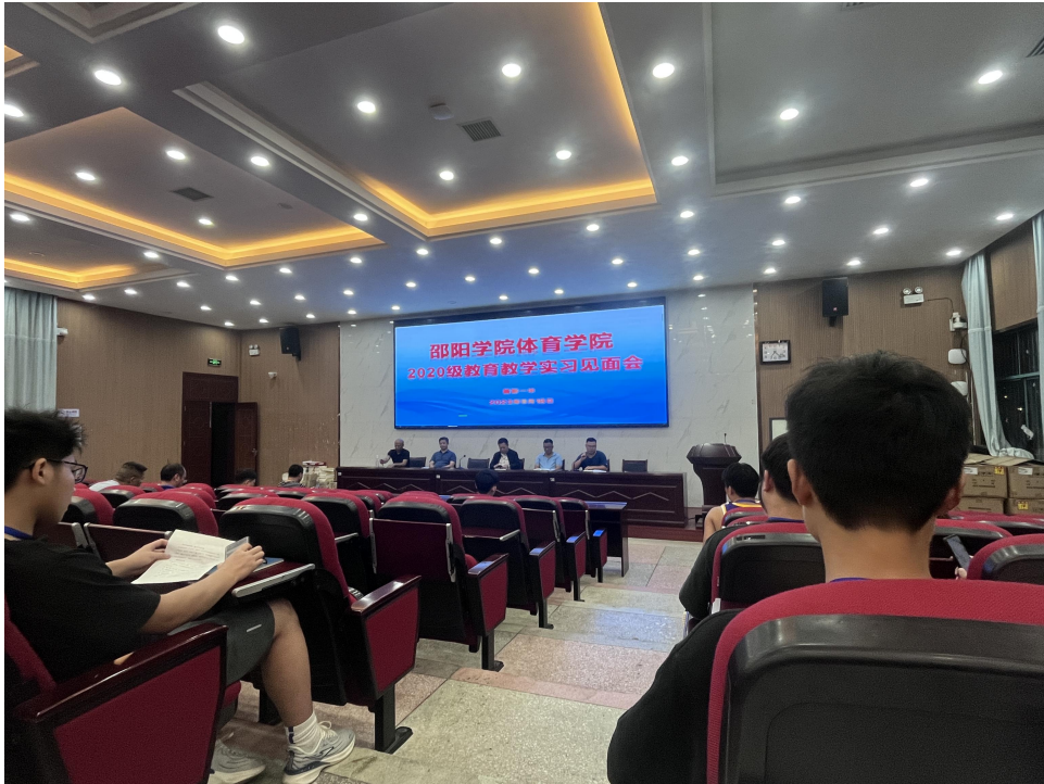
图为实习老师与各班主任会面