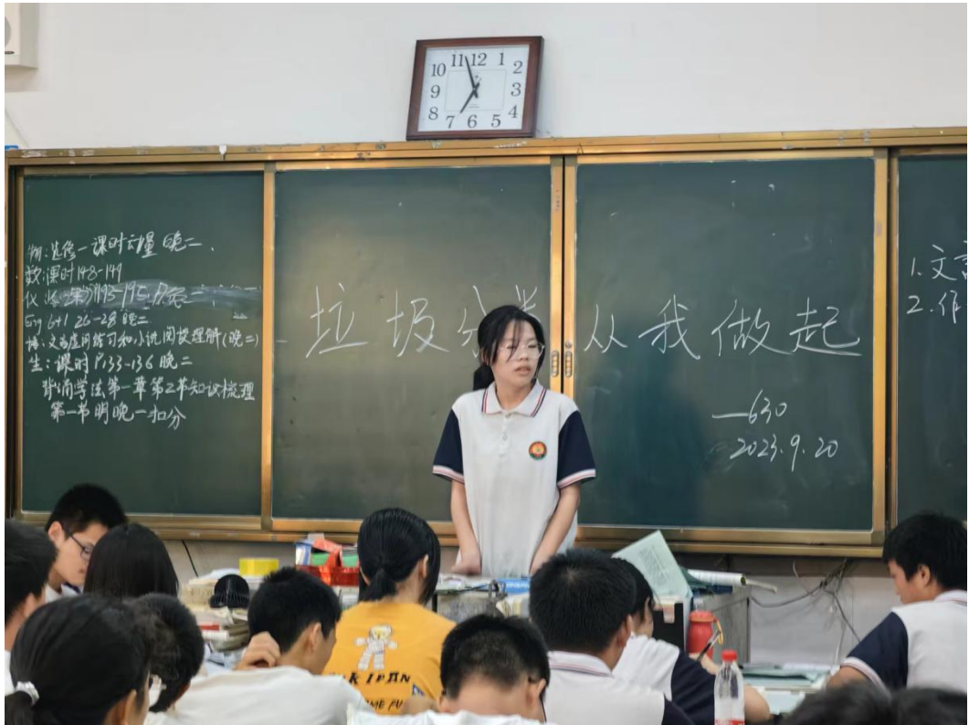
此图为“垃圾分类，从我做起”主题班会