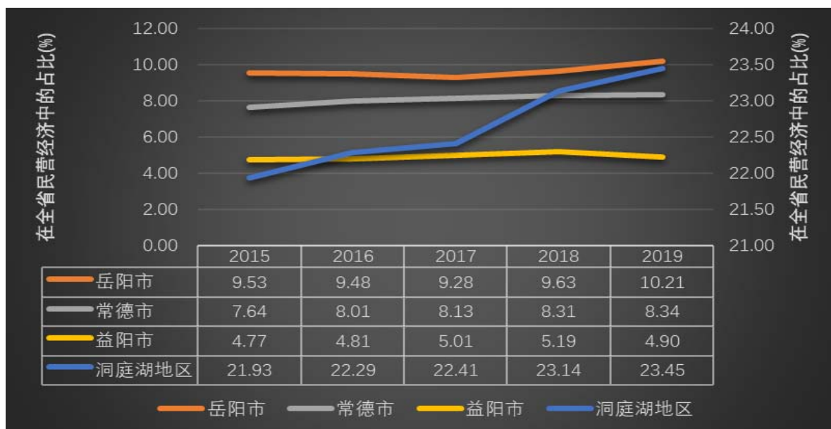
图 2 2015-2019 年洞庭湖地区民营经济总量在全省民营经济占比一览图

一些起伏，但都在同一时期提高了在全省整体民营经济中的份额（图 2），即分别从 2015 年的 9.5%-7.6%-4.7% 提高到 10.2%-8.3%-4.8%，这是非常值得关注的事实。