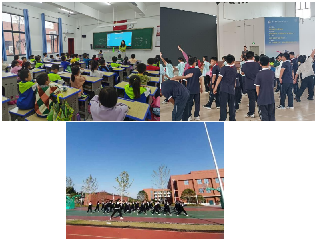
图 4-2 队员上课日常 2