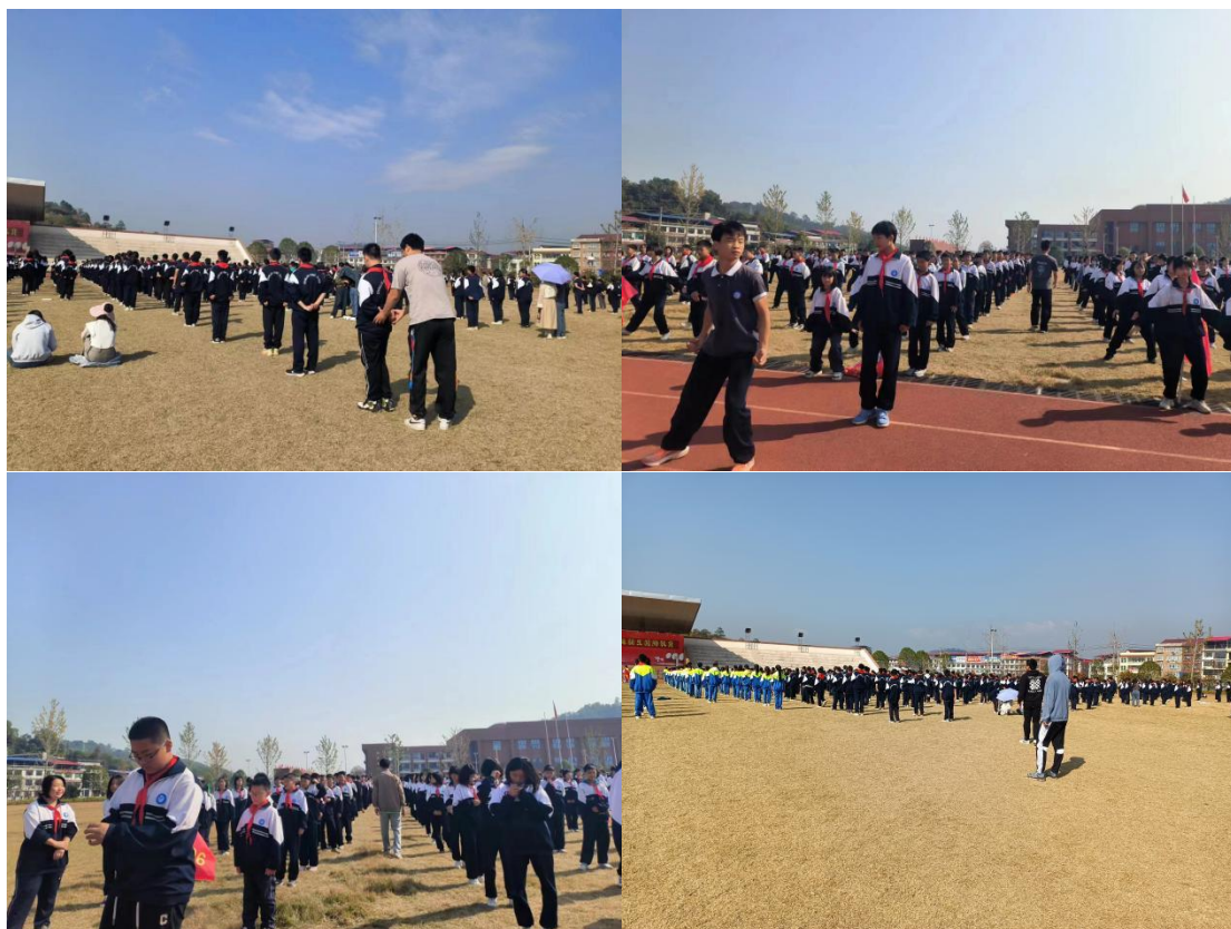
图 5-1 大课间过程纠正指导动作