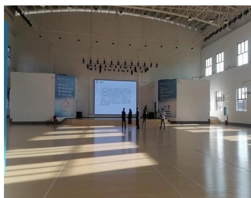
图 1 - 3 室内体育馆