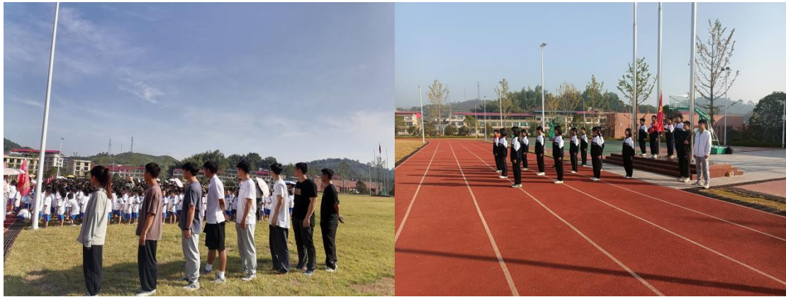
图 6-1 队员积极参加升旗仪式

学校每个星期一都会进行升旗仪式，参加升旗活动是表达爱国情感的一种方式，同时也是一种非常有意义的活动。升旗仪式能培养爱国精神：参加升旗活动可以让人们更好地了解自己的国家，增强爱国精神和国家意识；增强集体荣誉感：升旗活动是一个集体活动，参加升旗活动可以增强集体荣誉感和归属感。