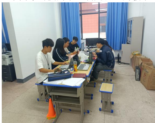
图 3-2 队员办公室办公备写教案

经过听课后的总结，迎来了我们的重头戏：备课。指导老师给予我们极大的信任，分配部分教学内容给我们，并按照自己的安排，自主完成全部的教学内容。在备课的过程中，我们认真分析所带年级学生的身心发展特点，根据不同阶段，不同年龄段的学生制定合适的教学计划，为接下来正式授课做充分的准备。