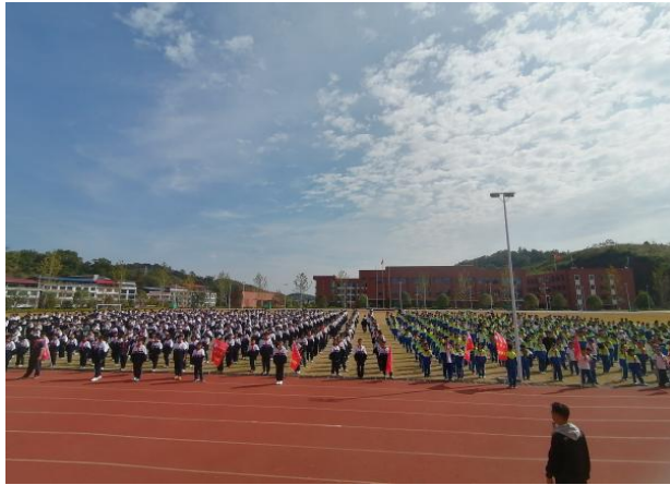
图 1 -4 室外田径场