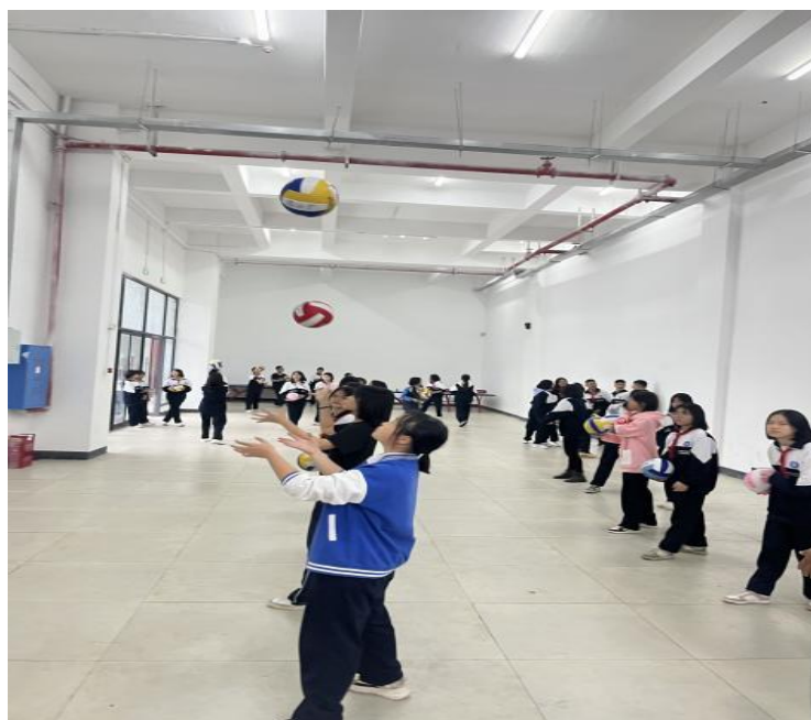
图 5-3 排球社团教学