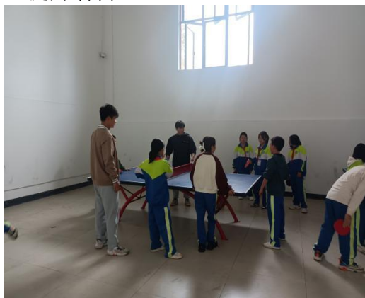
图 5-1 乒乓球社团教学

长郡蓝田润和学校对学生丰富的课外生活非常的重视，从小学低年级到初中都开展了适合学生的社团活动，有棋艺、武术、羽毛球、足球、篮球、排球、乒乓球生活、等社团，每个星期安排两节课社团课，使学生们能体会到丰富多彩的校园，同时还能学到不同的技能知识。学校分给了实习老师三门社团课程，分别是足球，排球，乒乓球三个社团，实习老师们都积极对待，提升学生的同时也提升着自己。