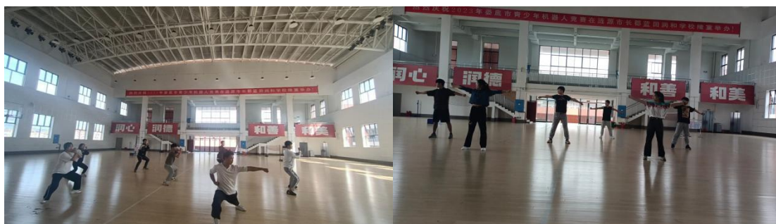
图 6-2 队员早训照片