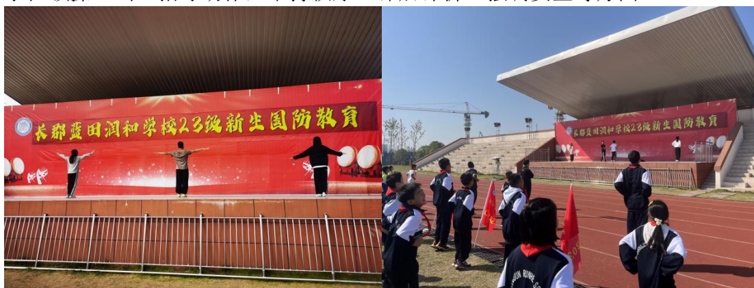
图 4-2 参与大课间武术操示范教学

绚丽多彩的大课间活动，作为学生校园生活的重要组成部分。不仅是一种丰富的校园文化，更是学生终身体育不可忽视的一个重要起点。本次实习的实习任务我方实习队积极配合长郡蓝田润和学校开展的大课间活动，主要负责模块教学、示范领操、纠正指导动作，维持秩序、课后评价、强调安全等方面。