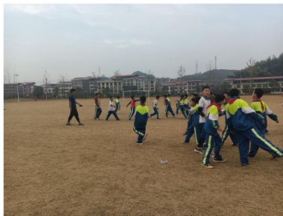
图 5-2 足球社团教学