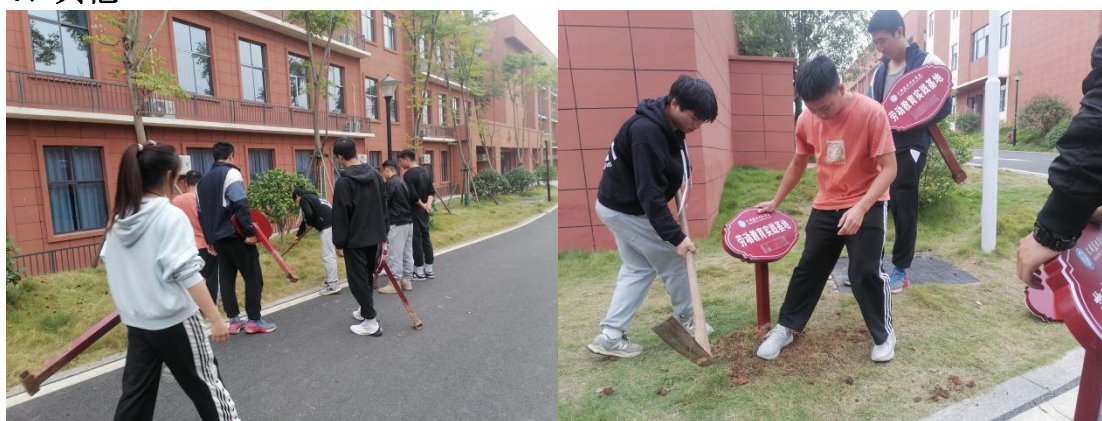
图 7-2 安插劳动课班级负责牌