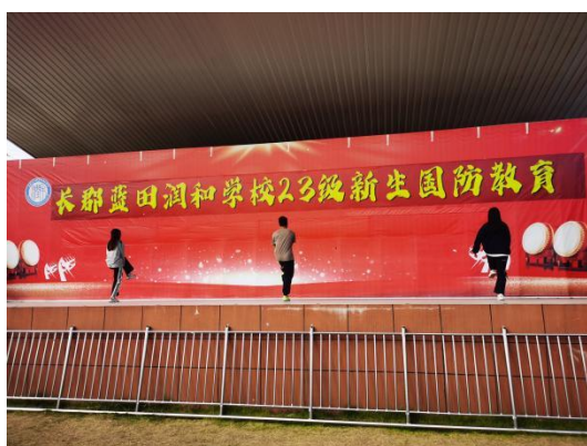
图 1 - 2 室外主席台