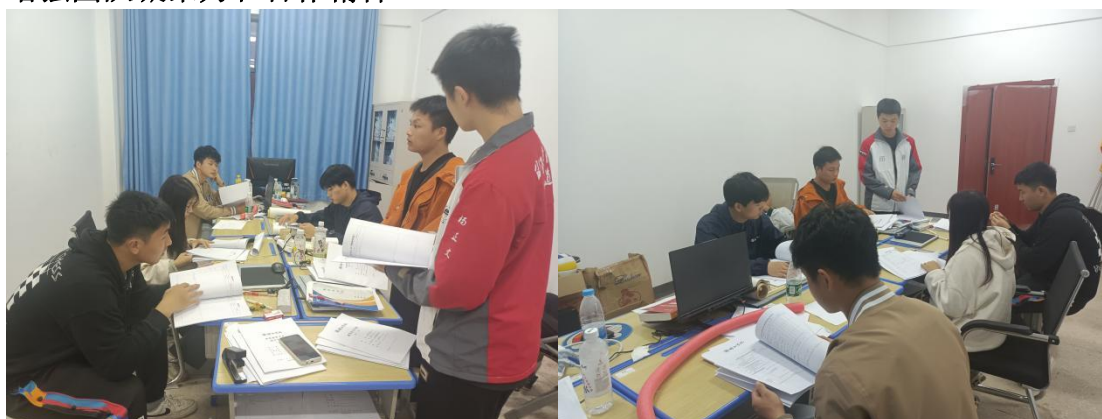
图 7-1 队员开会会照

开会是一种集体讨论和决策的方式，开会可以让团队成员更好地了解彼此的工作和进展情况，从而提高工作效率；开会可以让团队成员更好地了解彼此，增强团队凝聚力和合作精神。