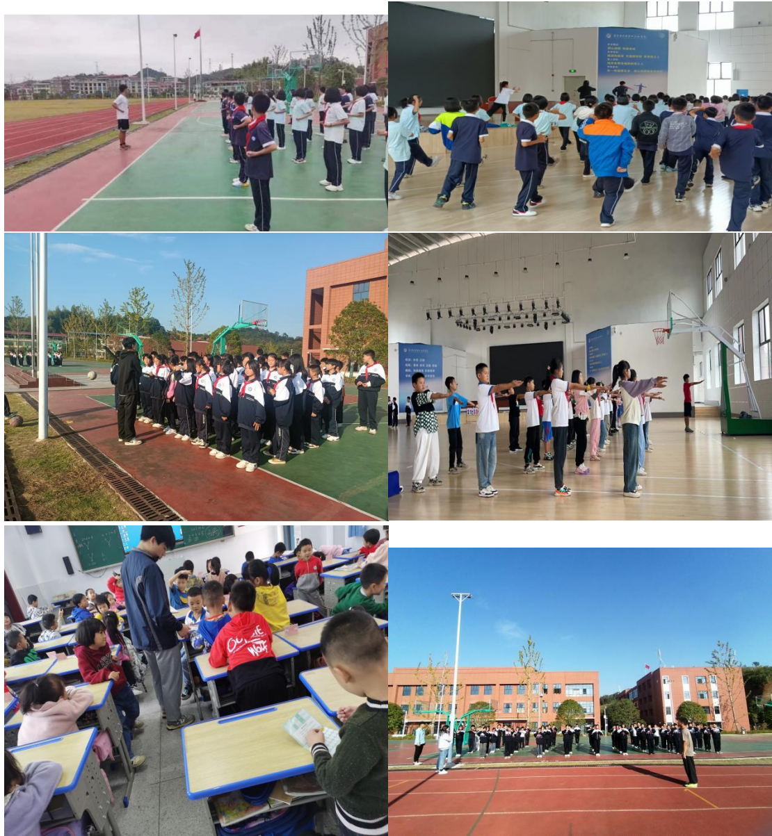
图 4-1 队员上课日常 1

在做好听课与备课的双重准备之后，我们充满信心的迎来了自己的第一堂课，在授课过程中，我们认真按照学校分配的教学任务，有效组织学生积极参与体育课堂中，并且严格要求自身做到示范规范、思路清晰、为人师表，认真负责地对待课堂与学生。