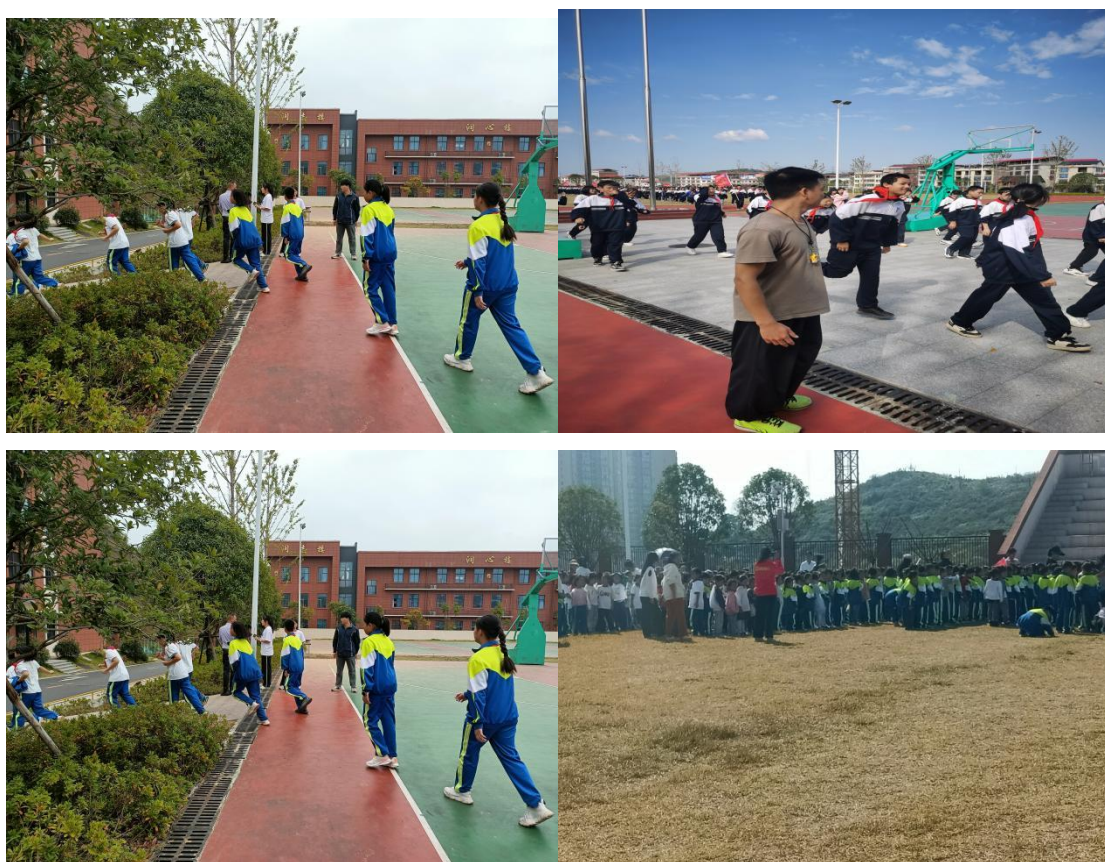
图 5-2 点位维持安全与纪律