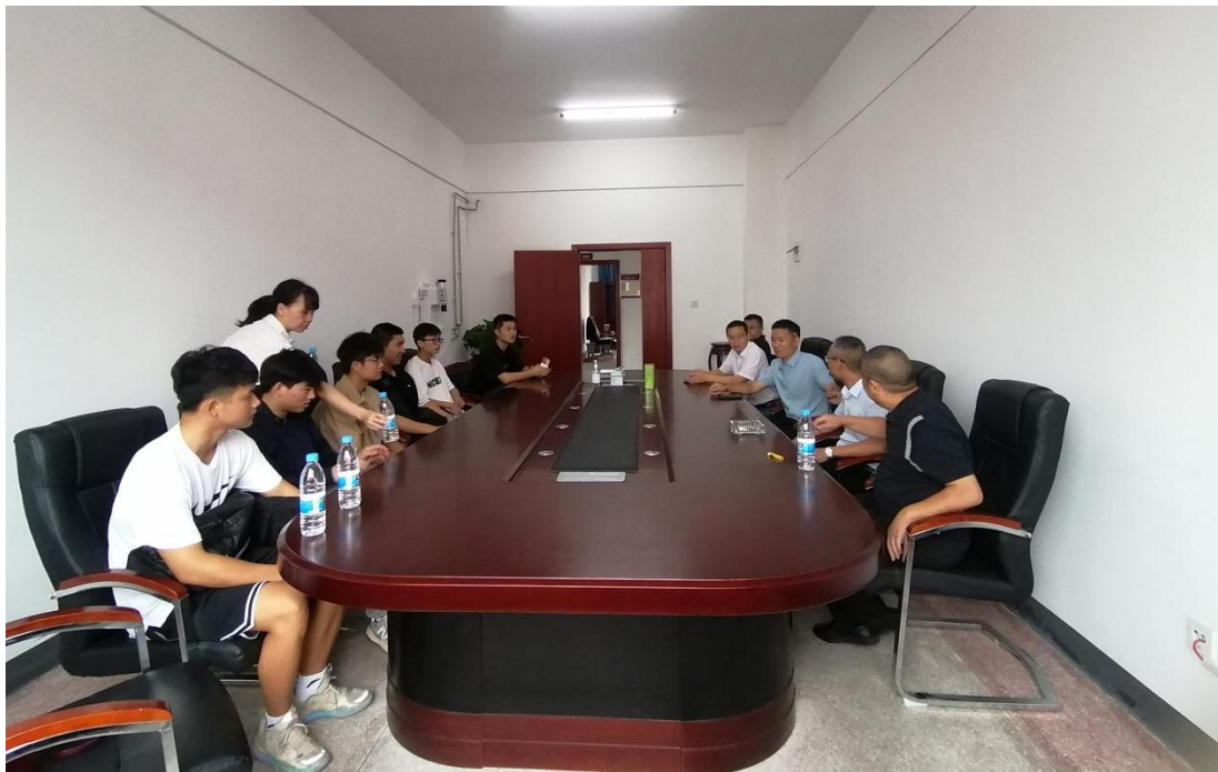
图 2-1 实习学校见面会

2023 年 9 月 15 日，邵阳学院体育系实习队伍 9 名同学在曾院长的带领下，走进了实习学校，在朴实楼四楼的报告厅里，长郡蓝田润和学校的德育处石校长给我们在座的各位同学介绍学校具体的详细情况，并对教师这一职业的具体要求给予说明，最后对我等各位实习同学的具体生活做了详细的安排。石校长的介绍以及各位领导的热情招待，让我们对实习生活充满了希望与憧憬，在这里，我们即将开启一段丰富而美好的实习经历，我们更坚信自己有能力去做好这件事情，因为我们已经准备好了！