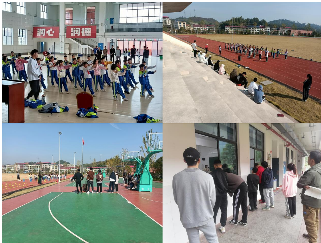
图 3-1 队员跟随学校领导，老师听课学习经验

在听课的期间，我们都会提前了解授课教师的教学安排与内容，认真记录老师的授课过程，虚心学习老师的授课思路与流程，学习其课堂的精彩部分，并在授课结束后，集体听取指导老师的指导与建议，做好自我反思与总结，为我们以后正式上课积累经验。