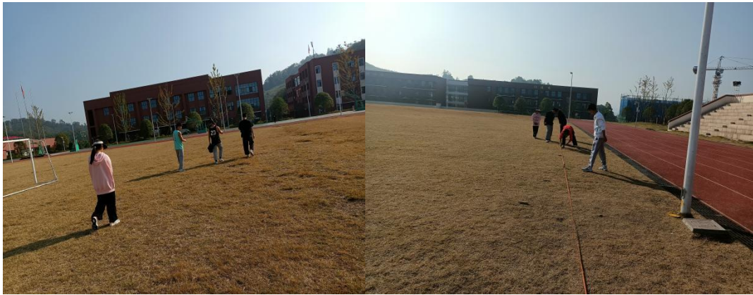
图 7-3 大课间学生点位定桩